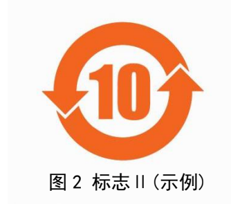
图 2 标志 II (示例)

4.1.2 选择采用图 2 进行标识的，电器电子产品的生产者或进口者可参照 SJ/Z 11388 或相关行业组织制定的关于环保使用期限的指导意见自行确定产品的环保使用期限，并将标志中的数字替换为被标识产品的实际环保使用期限。